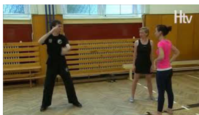
Kurz sebeobranu pro dívky a ženy 2014