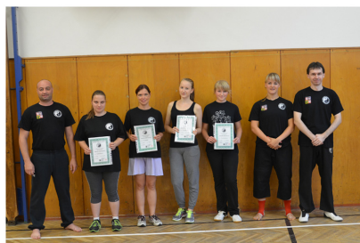
Kurz sebeobranu pro dívky a ženy 2015