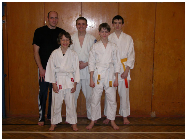
Trénink Karate Hustopeče 24. 03. 2011