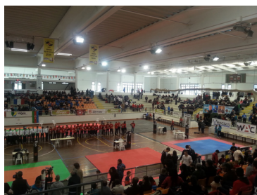
Zahájení mistrovství světa WAC & ICKKF 2015