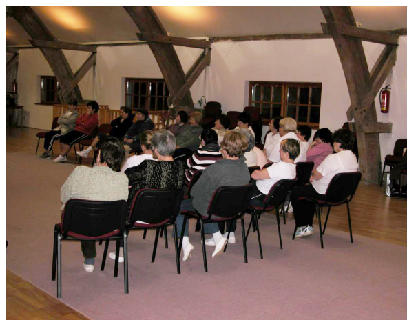
Přednáška pro seniorky Brno 26. 01. 2011