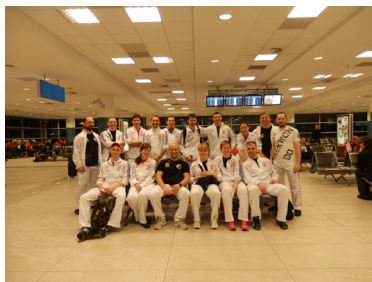
Asia Budo Center dobil svět!