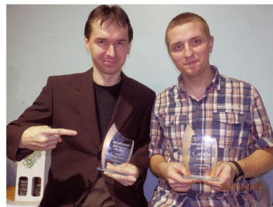
Sportovec roku 2014 města Hustopeče