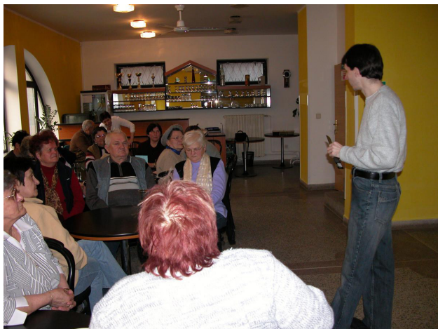
Přednáška pro seniory Starovice 23. 02. 2010