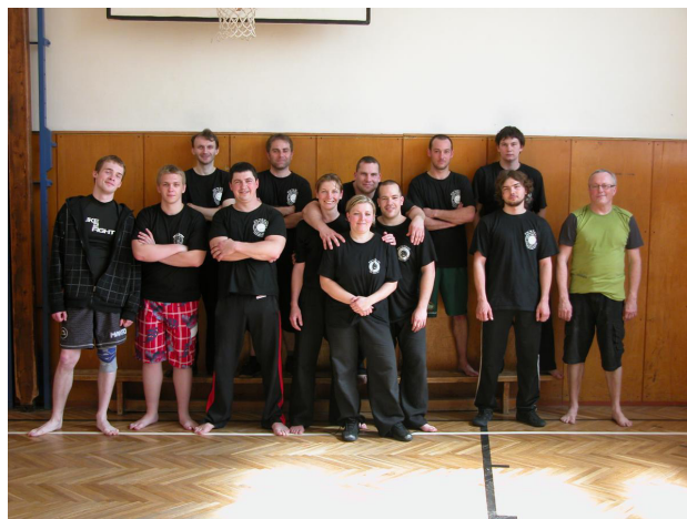
Workshop Krav Maga/Kapap Hustopeče 02. 04. 2011