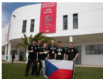
5. ročník WAC & ICKKF 2015